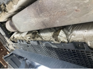
Kaporta, Muhafaza, arka > Hasarlı