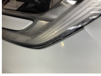
Farlar, Far camı, sol > Hasarlı