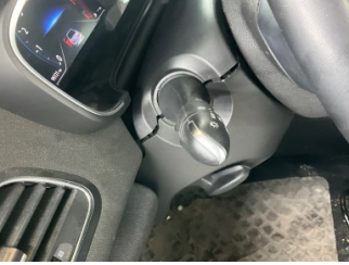
Direksiyon sistemi, Direksiyon - ilave parçalar/sabitlenmesi > Sabitlenmesi Hatalı