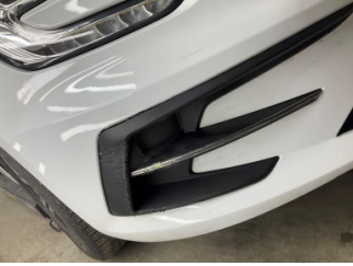
Sis lambaları, Sis Izgarası Sağ > Çizik