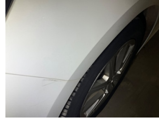
Çamurluk, sol, Çamurluk, sol > Yüzeysel Çizik