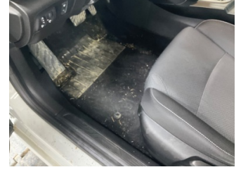
Taban, Paspaslar > Sökülmüş-Yok