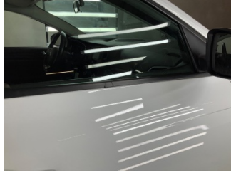
Camlar, Kapı camı fitili, sağ arka > Çizik