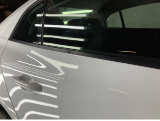
Camlar, Kapı camı fitili, sağ arka > Çizik