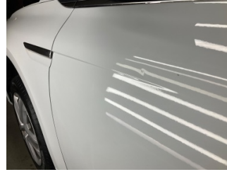
Kapı, sol ön, Kapı, sol > Noktasal Ezik