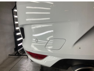
Tampon, arka, Arka tampon > Vuruk