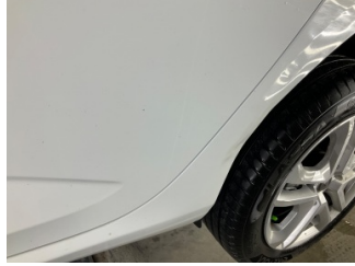
Çamurluk, sol arka, Çamurluk, sol arka > Hasarlı