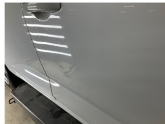
Kapı, sağ ön, Kapı, sağ > Ezik