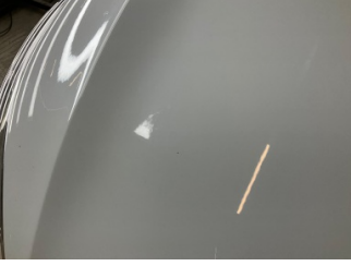
Motor kaputu, Motor kaputu > Yakıcı Madde Ile Zarar Görmüş