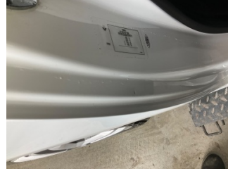
Kaporta, C-direk, sağ > Çizik