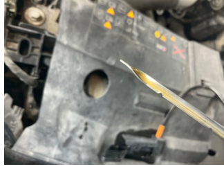
Motor, Yağ seviyesi > Eksik