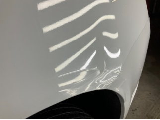
Çamurluk, sol arka, Çamurluk, sol arka > Hasarlı