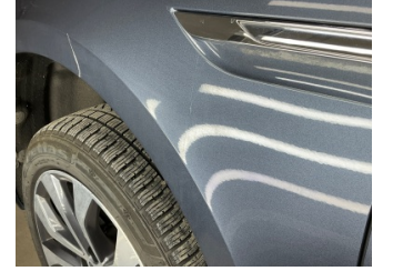
Çamurluk, sol, Çamurluk, sol > Küçük Çizik