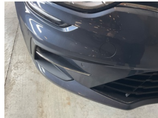
Tampon, ön, Ön tampon > Taş İzi