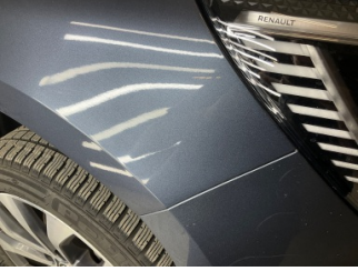
Çamurluk, sağ, Çamurluk, sağ > Taş İzi