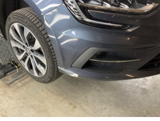
Tampon, ön, Ön tampon > Boyası Atmış

Sayfa: 11/12 Araç Çıkış Tarihi: 01.07.2026 16:04