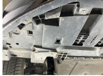
Tampon, ön, Tampon koruyucu orta > Çizik