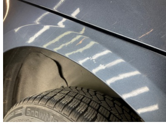
Çamurluk, sağ arka, Çamurluk, sağ arka > Standart Dışı Onarım