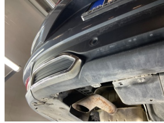
Tampon, arka, Spoiler > Çizik