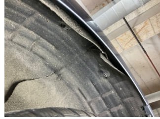
Çamurluk, sol arka, Davlumbaz > Sabitlemesi Hatalı