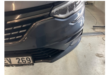
Tampon, ön, Ön tampon > Taş İzi