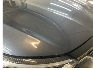
Motor kaputu, Motor kaputu > Taş Izı