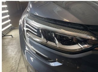
Farlar, Far camı, sağ > Taş İzi