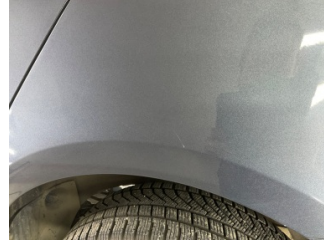
Çamurluk, sol arka, Çamurluk, sol arka > Küçük Çizik