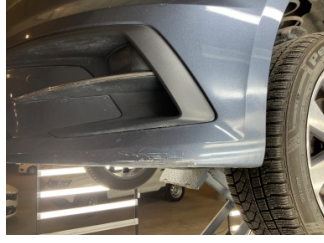
Tampon, ön, Ön tampon > Boyası Atmış