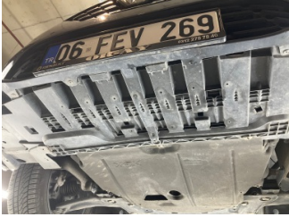
Tampon, ön, Tampon koruyucu orta > Çizik