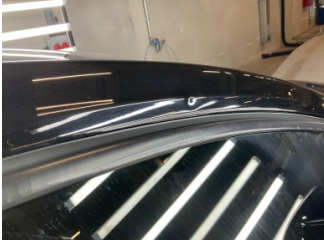
Tavan, Ön cam direği, sağ > Vuruk