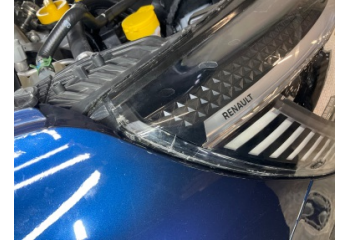
Farlar, Far camı, sağ > Çatlak