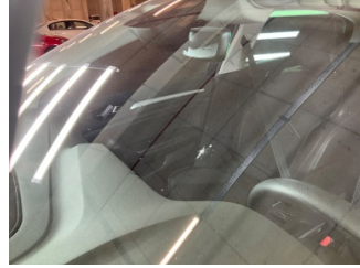
Camlar, Ön cam > Çatlak