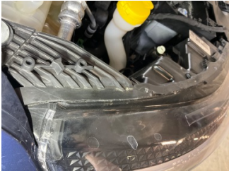
Farlar, Far camı, sağ > Çatlak