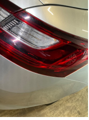
Arka lambalar, Arka lamba camı, sağ > Küçük Çizik