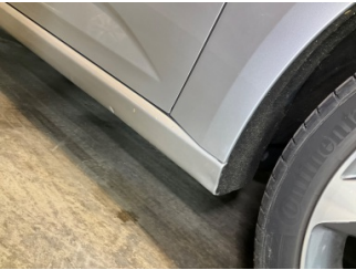
Marşbiyel, sağ, Marşbiyel, sağ > Vuruk