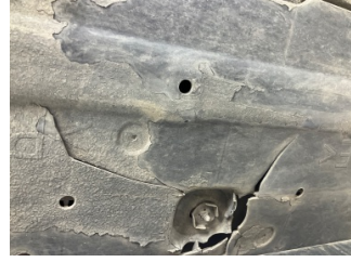
Kaporta, Muhafaza, orta > Hasarlı