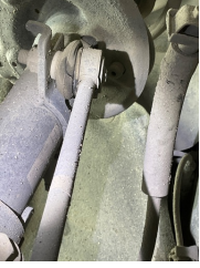
Ön aks, Denge çubuğu, bağlantı cubuğu sağ > Hasarlı