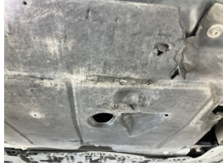
Motor, Alt muhafaza > Delinmiş