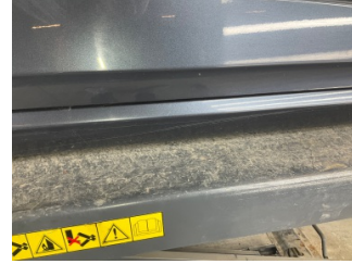
Marşbiyel, sağ, Marşbiyel, sağ > Çizik