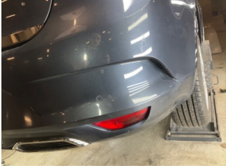
Tampon, arka, Arka tampon > Boyası Atmış