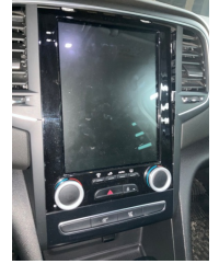
Komünikasyon/Navigasyon/Eğlence sistemleri, Komünikasyon ve navigasyon > Sabitlemesi Hatalı