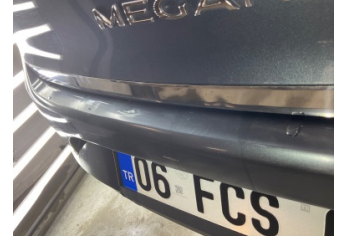
Tampon, arka, Arka tampon > Boyası Atmış