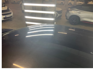
Tavan, Tavan > Yakıcı Madde İle Zarar Görmüş