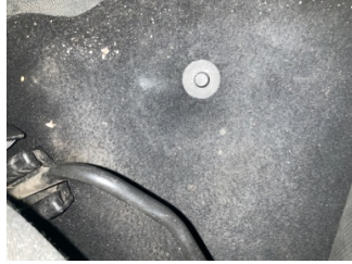
Döşemeler/Kapaklar, Döşemeler/Kapaklar > Yakıcı Madde Ile Zarar Görmüş