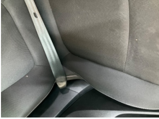
Döşemeler/Kapaklar, Döşemeler/Kapaklar > Yakıcı Madde Ile Zarar Görmüş