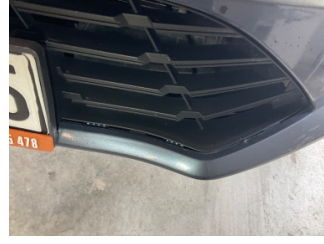
Tampon, ön, Ön tampon ızgarası > Sabitlemesi Hatalı