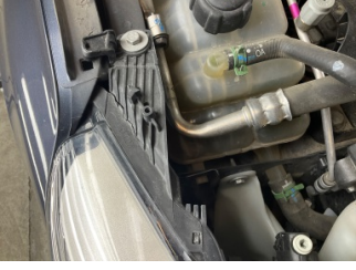
Farlar, Far camı, sağ > Hasarlı