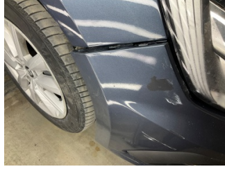
Tampon, ön, Bağlantı ayağı > Kırılmış