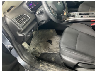
Taban, Paspaslar > Hasarlı