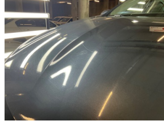
Motor kaputu, Motor kaputu > Yakıcı Madde ile Zarar Görmüş