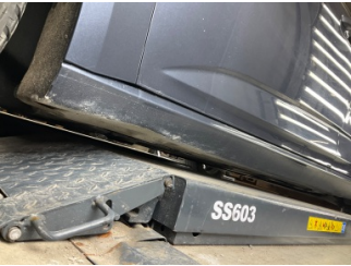
Marşbiyel, sağ, Marşbiyel, sağ > Küçük Vuruk