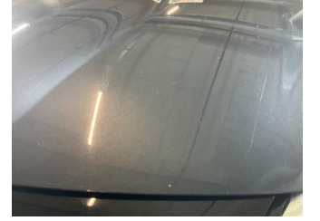
Motor kaputu, Motor kaputu > Taş İzi