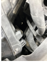
Farlar, Far camı, sağ > Hasarlı