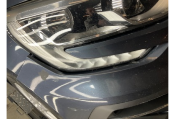
Farlar, Far camı, sağ > Islak- Nemli