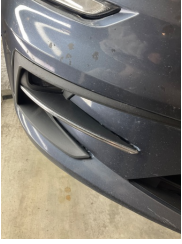
Sis lambaları, Sis ızgarası Sağ > Sabitlemesi Hatalı