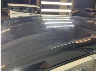
Tavan, Tavan > Yakıcı Madde İle Zarar Görmüş