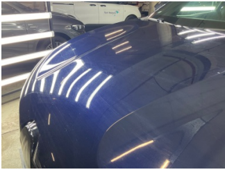
Motor kaputu, Motor kaputu > Yakıcı Madde İle Zarar Görmüş