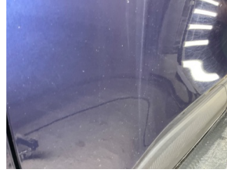
Kapı, sol ön, Kapı, sol ön > Taş İzi