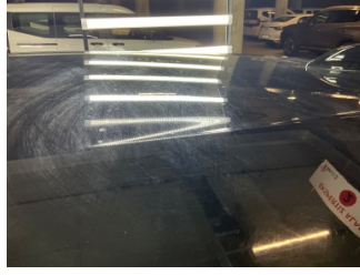
Tavan, Tavan > Yakıcı Madde İle Zarar Görmüş