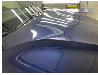
Motor kaputu, Motor kaputu > Yakıcı Madde İle Zarar Görmüş