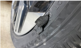
Lastik, sağ arka > Hasarlı