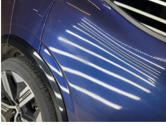
Kapı, sağ arka, Kapı, sağ arka > Deforme Olmuş