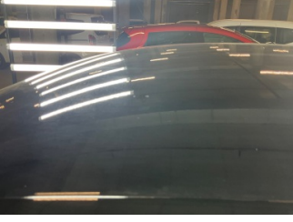
Tavan, Tavan > Yakıcı Madde İle Zarar Görmüş