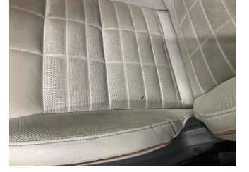
Koltuklar, ön, Koltuk döşemesi, sol ön > Hasarlı