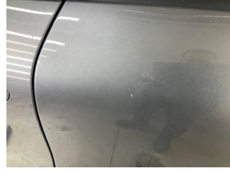
Kapı, sol arka, Kapı, sol arka > Taş İzi