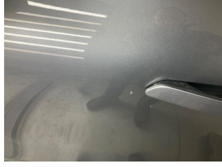
Kapı, sol ön, Kapı, sol > Taş İzi