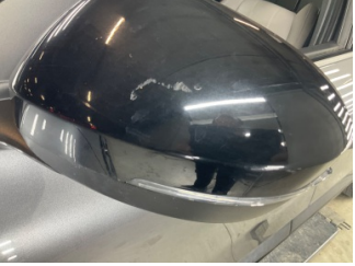
Dikiz aynası, sol, Dış dikiz aynası kapağı > Çizik