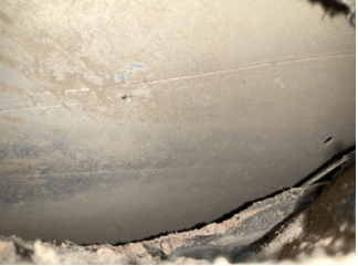
Kaporta, Araç gövdesi altı, arka > Çizik