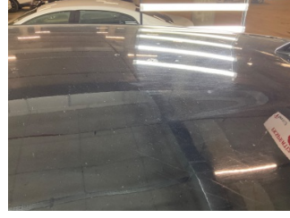
Tavan, Tavan > Yakıcı Madde ile Zarar Görmüş