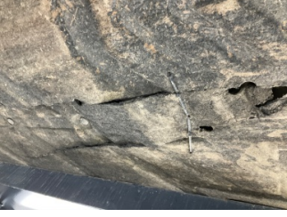
Kaporta, Muhafaza, arka > Hasarlı