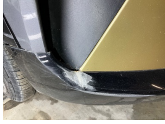
Tampon, ön, Ön tampon > Standart Dışı Onarım