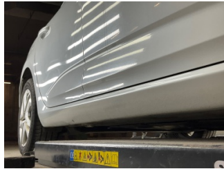
Marşbiyel, sağ, Marşbiyel, sağ > Vuruk