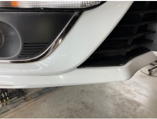
Tampon, ön, Ön tampon > Vuruk