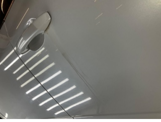
Kapı, sağ ön, Kapı, sağ ön > Yakıcı Madde Ile Zarar Görmüş