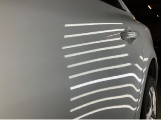
Kapı, sol arka, Kapı, sol arka > Çizik