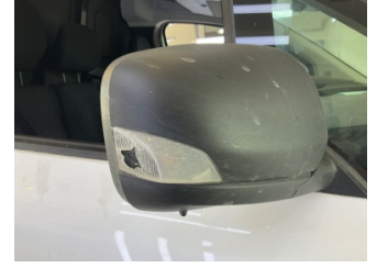
Dikiz aynası, sağ, Sinyal lambası > Hasarlı