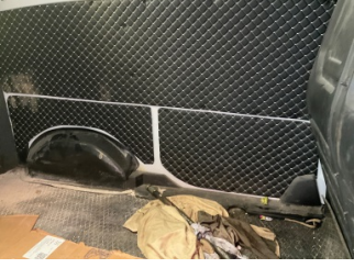
Döşemeler/Kapaklar, Döşemeler/Kapaklar > Standart Dışı Onarım