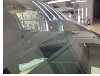
Camlar, Ön cam > Taş İzi