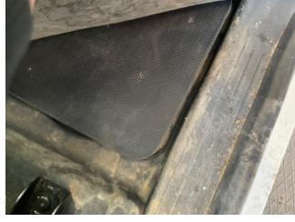
Döşemeler/Kapaklar, Döşemeler/Kapaklar > Standart Dışı Onarım