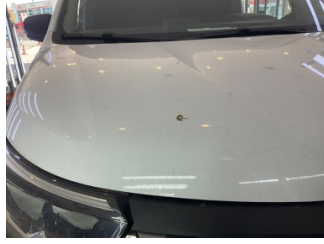
Motor kaputu, Motor kaputu > Yakıcı Madde İle Zarar Görmüş