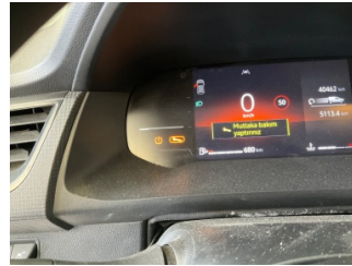
Motor, Motor > Uyarı Lambası Yanıyor