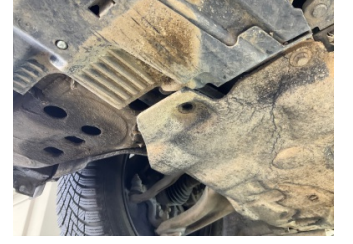
Motor, Alt muhafaza > Sabitlemesi Hatalı