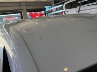
Tavan, Tavan > Yakıcı Madde İle Zarar Görmüş