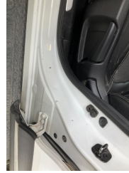
Kaporta, B-direk, sol > Çizik