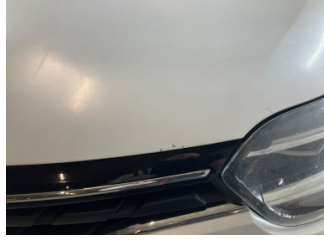
Motor kaputu, Motor kaputu > Taş lzi