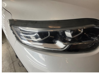
Farlar, Far camı, sağ > Deforme Olmuş