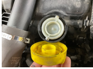
Motor, Yağ kontrol cubuğu > Onaysız