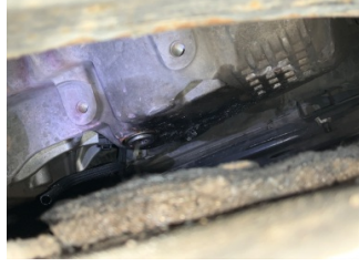
Motor, Yağ karteri > Sızdırıyor