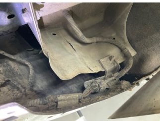
Arka bölüm, Arka sac/panel > Vuruk