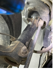
Ön aks, Denge çubuğu, bağlantı cubuğu sol > Hasarlı