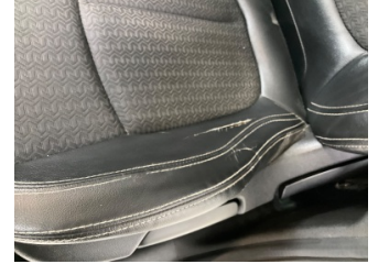
Döşemeler/Kapaklar, Döşemeler/Kapaklar > Hasarlı