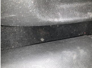
Döşemeler/Kapaklar, Döşemeler/Kapaklar > Hasarlı