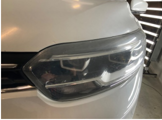
Farlar, Far camı, sol > Deforme Olmuş