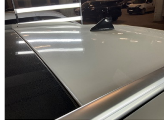
Tavan, Tavan > Yakıcı Madde İle Zarar Görmüş