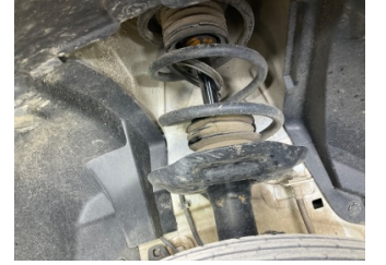
Ön aks, Amortisör körüğü, sol > Hasarlı