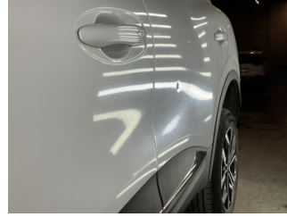
Kapı, sol arka, Kapı, sol arka > Noktasal Ezik