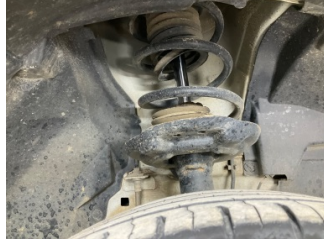
Ön aks, Amortisör körüğü, sağ > Hasarlı