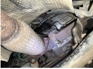
Motor, Turbo hortumları > Yağ Kaçığı