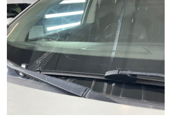
Camlar, Ön cam > Hasarlı