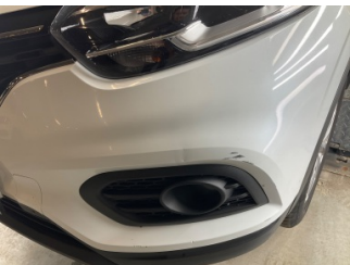
Tampon, ön, Ön tampon > Ezik