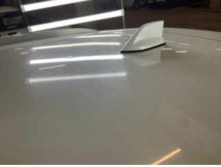
Tavan, Tavan > Dolu Hasarı