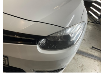
Farlar, Far camı, sol > Deforme Olmuş