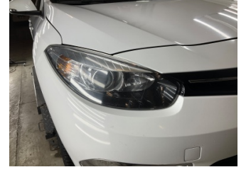
Farlar, Far camı, sağ > Deforme Olmuş