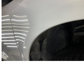
Çamurluk, sağ, Çamurluk, sağ > Vuruk