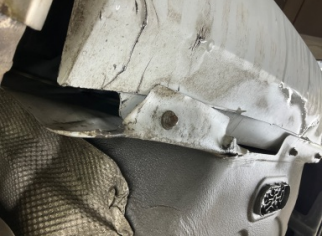
Arka bölüm, Arka sac/panel > Ezik