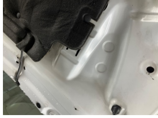
Motor kaputu, Motor kaputu > Standart Dışı Onarım