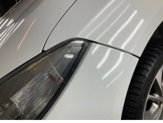
Tampon, ön, Ön tampon > Sabitlemesi Hatalı