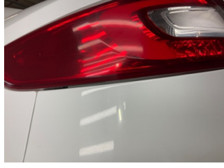
Arka lambalar, Arka lamba camı, sol > Sabitlemesi Hatalı