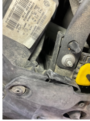
Farlar, Far bağlantı ayağı, sağ > Standart Dışı Onarım