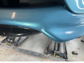
Tampon, ön, Spoiler > Boyası Atmış