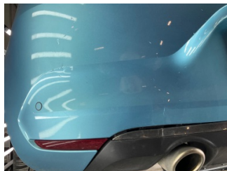
Tampon, arka, Arka tampon > Ezic