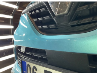
Tampon, ön, Ön tampon > Ezic