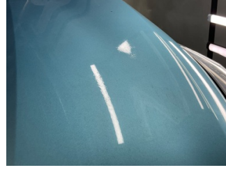
Motor kaputu, Motor kaputu > Deforme Olmuş