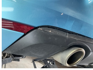
Tampon, arka, Spoiler > Sabitlemesi Hatalı