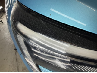
Farlar, Far camı, sağ > Deforme Olmuş