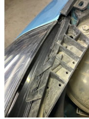
Farlar, Far bağlantı ayağı, sağ > Standart Dışı Onarım