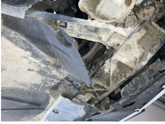
Kaporta, Araç gövdesi altı, ön > Kirlenmiş