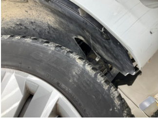
Çamurluk, sağ, Davlumbaz > Hasarlı