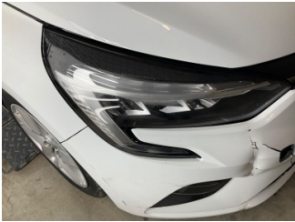
Farlar, Far, sağ > Islak-Nemli