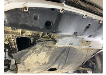
Tampon, ön, Tampon koruyucu orta > Hasarlı