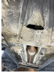
Kaporta, Araç gövdesi altı, ön > Kirlenmiş