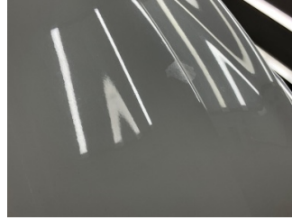
Motor kaputu, Motor kaputu > Yakıcı Madde Ile Zarar Görmüş