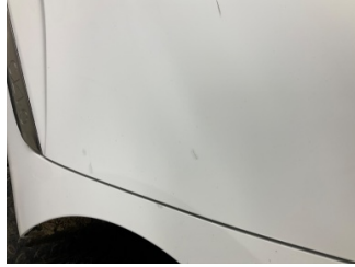
Kapı, sol arka, Kapı, sol arka > Küçük Çizik