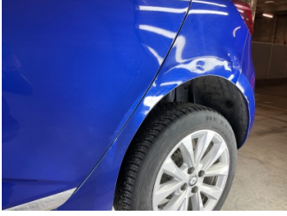
Çamurluk, sol arka, Çamurluk, sol arka > Hasarlı