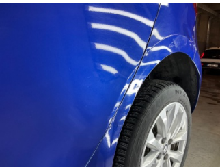
Kapı, sol ön, Kapı, sol ön > Ezik