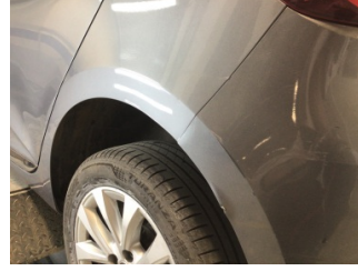
Çamurluk, sol arka, Çamurluk, sol arka > Hasarlı