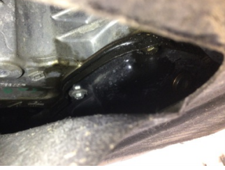
Motor, Yağ karteri > Yağ Kaçağı