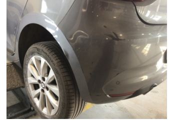
Tampon, arka, Arka tampon > Hasarlı