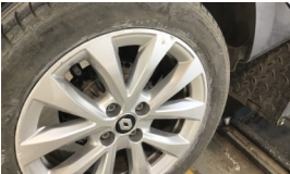
Jant, sağ arka > Çizik