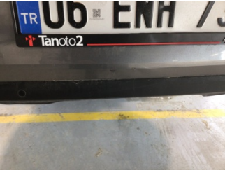
Tampon, arka, Arka tampon > Hasarlı