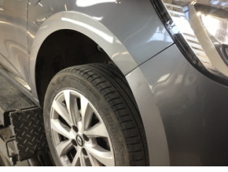
Çamurluk, sağ, Çamurluk, sağ > Ezik