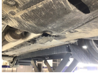
Motor, Alt muhafaza > Hasarlı