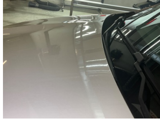
Kaporta, Kaporta > Dolu Hasarı