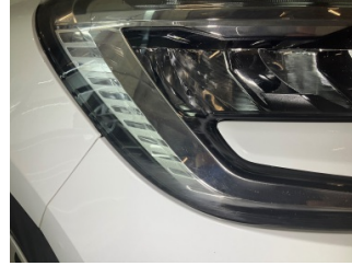
Farlar, Far camı, sağ > Çizik