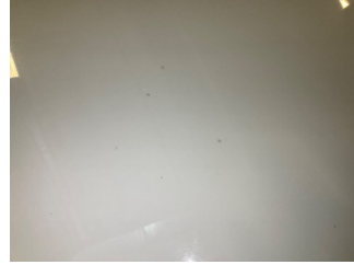
Motor kaputu, Motor kaputu > Yakıcı Madde ile Zarar Görmüş