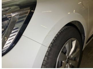
Çamurluk, sol, Çamurluk, sol > Yüzeysel Çizik