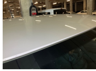
Tavan, Tavan, ön cam üstü > Boyası Atmış