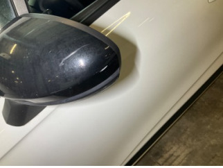
Dikiz aynası, sol, Dış dikiz aynası kapağı > Küçük Çizik