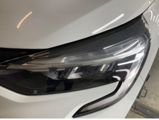
Farlar, Far camı, sol > Islak-Nemli