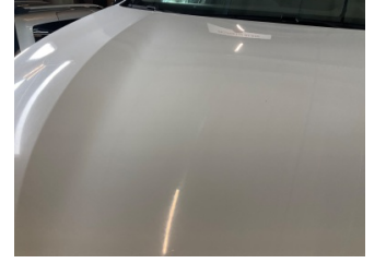
Motor kaputu, Motor kaputu > Standart Dışı Onarım