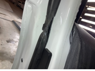
Kapı, sol ön, Kapı fitili > Hasarlı

Sayfa: 10/12 Araç Çıkış Tarihi: 10.06.2026 15:50