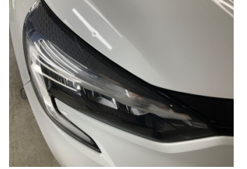
Farlar, Far camı, sağ > Islak-Nemli