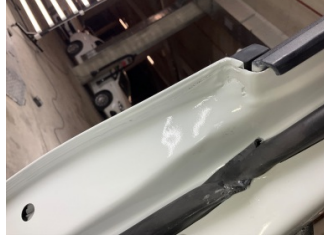
Kapı, sol ön, Kapı, sol ön > Standart Dışı Onarım