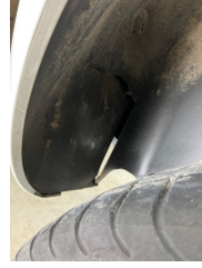
Çamurluk, sağ arka, Davlumbaz > Hasarlı