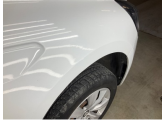
Çamurluk, sağ, Çamurluk, sağ > Standart Dışı Onarım