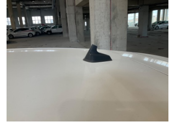
Komünikasyon/Navigasyon/Eğlence sistemleri, Anten > Sökülmüş-Yok