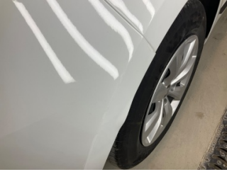
Tampon, arka, Arka tampon > Rötüş