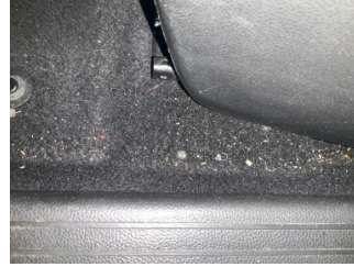
Taban, Taban halısı > Yakıcı Madde ile Zarar Görmüş