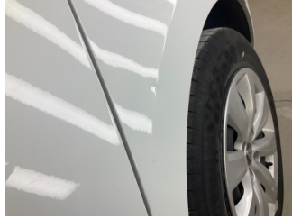
Çamurluk, sol, Çamurluk, sol > Noktasal Ezik