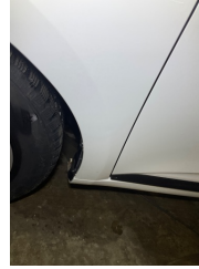
Çamurluk, sol, Çamurluk, sol > Noktasal Ezik