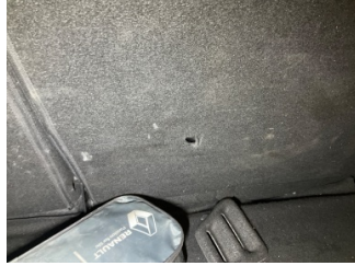
Koltuklar, arka, Arka koltuk döşemesi > Delinmiş