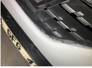
Tampon, ön, Ön tampon > Sabitlemesi Hatalı