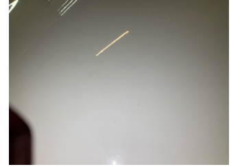
Motor kaputu, Motor kaputu > Yakıcı Madde Ile Zarar Görmüş