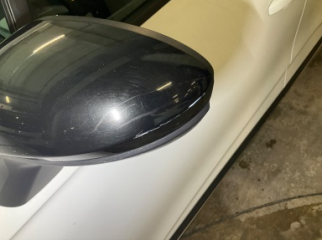
Dikiz aynası, sol, Dış dikiz aynası kapağı > Çizik