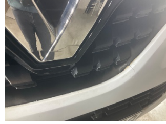
Motor kaputu, Amblem > Hasarlı