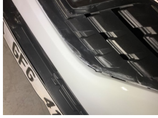
Tampon, ön, Ön tampon > Standart Dışı Onarım