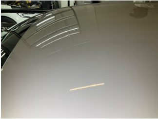
Tavan, Tavan > Dolu Hasarı