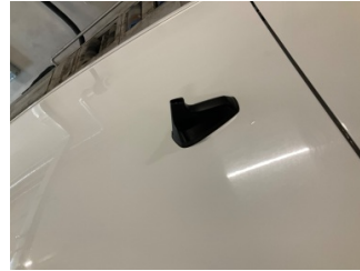
Komünikasyon/Navigasyon/Eğlence sistemleri, Anten > Sökülmüş-Yok