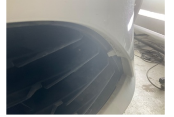
Tampon, ön, Ön tampon ızgarası > Sabitlemesi Hatalı