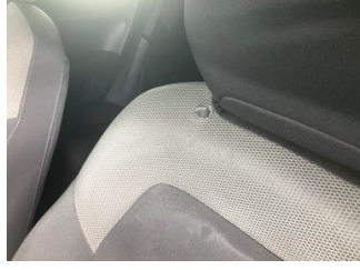
Koltuklar, ön, Koltuk döşemesi, sol ön > Hasarlı