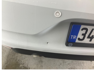
Tampon, arka, Arka tampon > Delinmiş