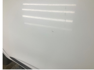
Kapı, sol ön, Kapı, sol > Noktasal Ezik