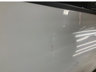
Kapı, sağ ön, Kapı, sağ > Ezik