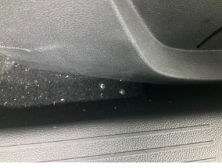
Taban, Taban halısı > Yakıcı Madde ile Zarar Görmüş

Rapor Tarihi: 04.06.2026 15:54 Bayi No: 0601 Sayfa: 11/12 Rapor No: 06-01-3487457 Araç Giriş Tarihi: 12.05.2026 09:31 Araç Çıkış Tarihi: 04.06.2026 15:54 Mersis No: 0309073518100001