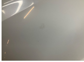
Motor kaputu, Motor kaputu > Yakıcı Madde Ile Zarar Görmüş