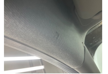
Döşemeler/Kapaklar, Tavan döşemesi > Yakıcı Madde Ile Zarar Görmüş