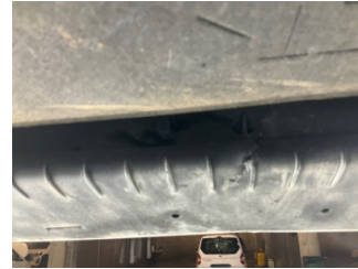
Kaporta, Muhafaza, arka > Kırılmış