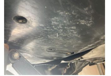
Kaporta, Muhafaza, arka > Kırılmış