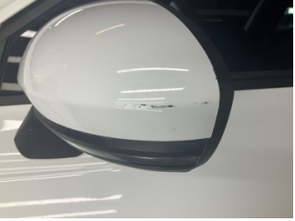
Dikiz aynası, sol, Dış dikiz aynası kapağı > Çizik