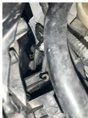
Çamurluk, sağ, Bağlantı ayağı > Ezik