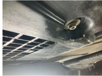
Kaporta, Muhafaza, arka > Kırılmış