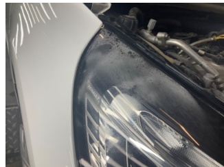
Farlar, Far, sağ > Islak-Nemli