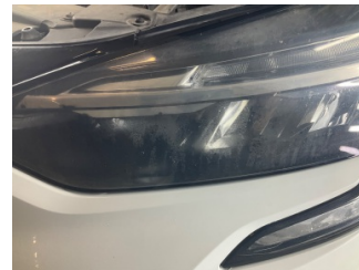
Farlar, Far, sol > Islak-Nemli