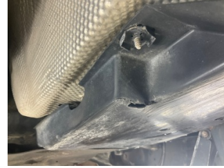
Kaporta, Muhafaza, arka > Kırılmış