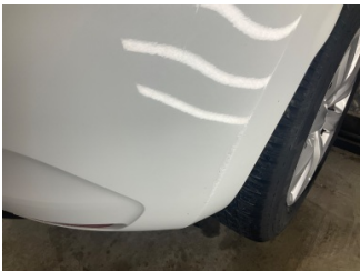
Tampon, arka, Arka tampon > Rötüş