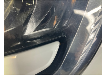
Farlar, Far camı, sol > Çatlak