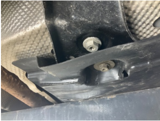
Kaporta, Muhafaza, arka > Kırılmış