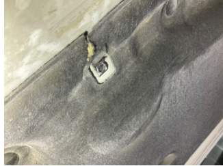
Motor kaputu, Dayama çubuğu/Amortisör > Kırılmış