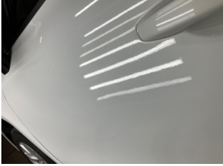
Kapı, sol ön, Kapı, sol ön > Boyası Atmış