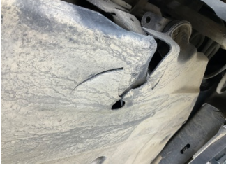
Kaporta, Muhafaza, arka > Hasarlı

Sayfa: 10/12 Araç Çıkış Tarihi: 01.06.2026 17:24