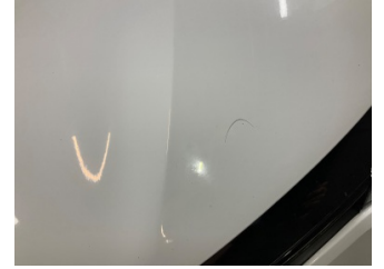
Motor kaputu, Motor kaputu > Boyası Atmış