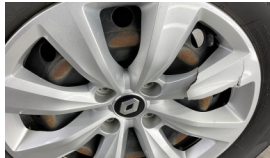
Lastik, sol arka > Hasarlı