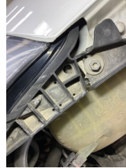
Farlar, Far bağlantı ayağı, sağ > Hasarlı