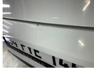
Tampon, arka, Arka tampon > Küçük Çizik