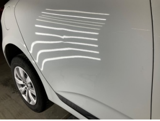
Kapı, sağ arka, Kapı, sağ arka > Vuruk