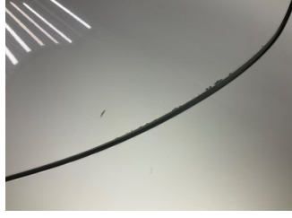
Kapı, sol arka, Kapı, sol arka > Küçük Çizik