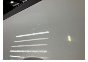
Kapı, sol ön, Kapı, sol ön > Boyası Atmış