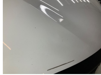
Motor kaputu, Motor kaputu > Boyası Atmış