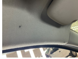
Döşemeler/Kapaklar, Tavan döşemesi > Yakıcı Madde ile Zarar Görmüş