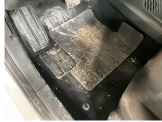
Taban, Paspaslar > Eksik