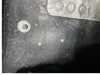
Taban, Taban halısı > Yakıcı Madde ile Zarar Görmüş