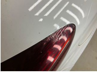
Arka lambalar, Arka lamba camı, sağ > Hasarlı