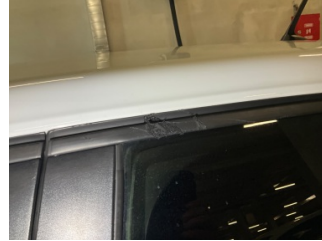
Kapı, sol arka, Cam sıyrıcı fitili, dış > Çizik