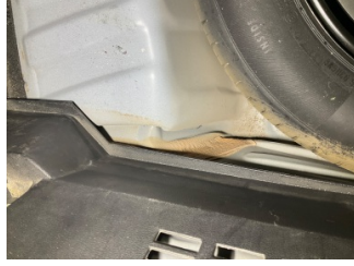
Arka bölüm, Bagaj havuzu > Hasarlı