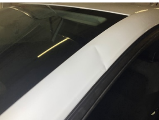
Tavan, Ön cam direği, sol > Ezik