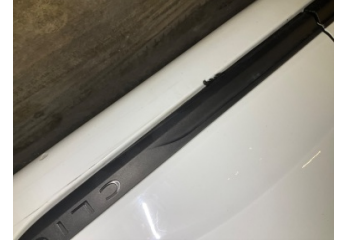
Kapı, sol ön, Kapı bandı > Çizik