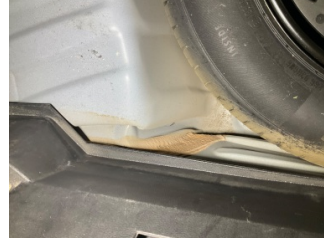
Arka bölüm, Arka sac/panel > Hasarlı