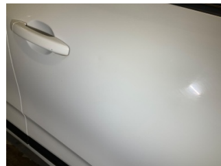
Kapı, sağ ön, Kapı, sağ ön > Vuruk