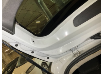
Döşemeler/Kapaklar, Pandizot > Onaysız