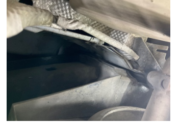
Arka bölüm, Arka sac/panel > Hasarlı