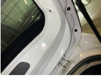
Döşemeler/Kapaklar, Pandizot > Onaysız