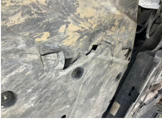
Kaporta, Muhafaza, arka > Hasarlı