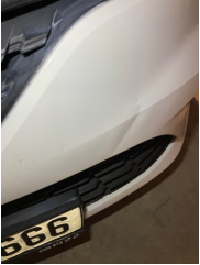
Tampon, ön, Ön tampon > Ezik