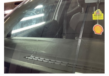
Camlar, Ön cam > Hasarlı