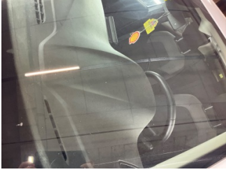
Camlar, Ön cam > Hasarlı