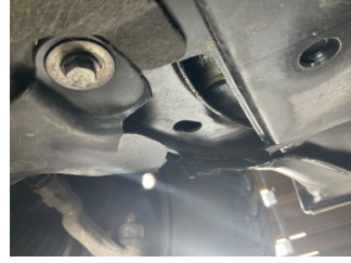
Kaporta, Araç gövdesi altı, ön > Hasarlı