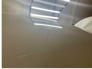
Tavan, Tavan > Yakıcı Madde İle Zarar Görmüş