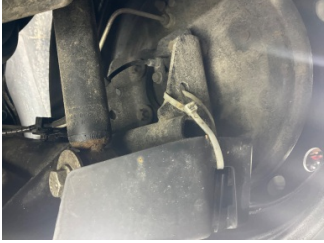
Kaporta, Araç gövdesi altı, arka > Standart Dışı Onarım