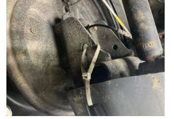
Kaporta, Araç gövdesi altı, arka > Standart Dışı Onarım