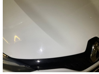
Motor kaputu, Motor kaputu > Taş izi