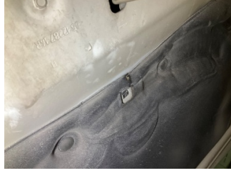
Motor kaputu, Dayama çubuğu/Amortisör > Kırılmış