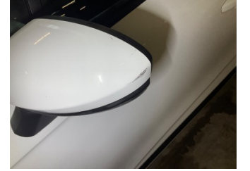
Dikiz aynası, sol, Dış dikiz aynası kapağı > Çizik