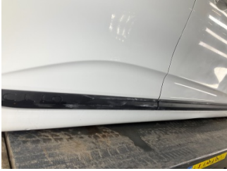
Kapı, sağ arka, Kapı bandı > Çizik