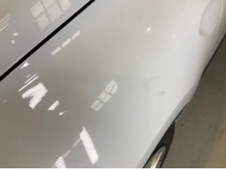
Çamurluk, sol, Çamurluk, sol > Ezik