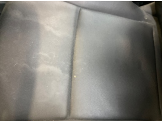
Koltuklar, ön, Koltuk döşemesi, sol ön > Yakıcı Madde ile Zarar Görmüş