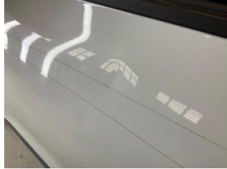
Kapı, sol ön, Kapı, sol > Ezik