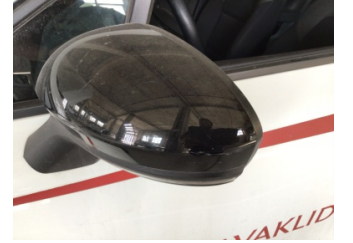
Dikiz aynası, sol, Dış dikiz aynası kapağı > Çizik