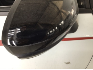
Dikiz aynası, sağ, Dış dikiz aynası kapağı > Çizik