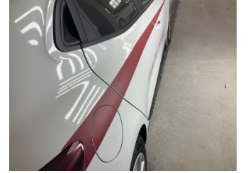
Kaporta, Kaporta > Etiket Yapıştırılmış