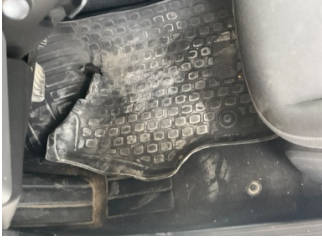
Taban, Paspaslar > Hasarlı