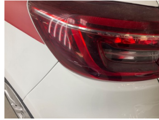
Arka lambalar, Arka lamba camı, sol > Çizik