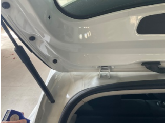
Döşemeler/Kapaklar, Pandizot > Sabitlemesi Hatalı