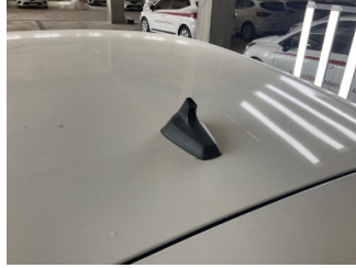
Komünikasyon/Navigasyon/Eğlence Kaporta, Kaporta > Etiket sistemleri, Anten > Sökülmüş-Yok Yapıştırılmış