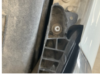
Farlar, Far bağlantı ayağı, sol > Standart Dışı Onarım