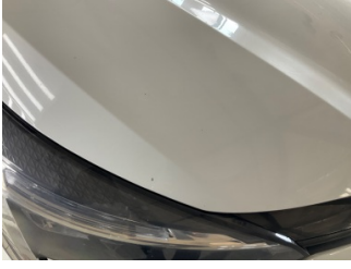
Motor kaputu, Motor kaputu > Taş lzi