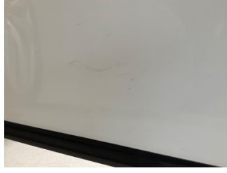
Kapı, sol ön, Kapı, sol ön > Rötüş