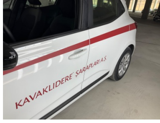
Kaporta, Kaporta > Etiket Yapıştırılmış