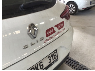
Kaporta, Kaporta > Etiket Yapıştırılmış