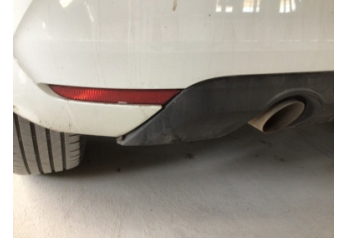
Tampon, arka, Spoiler > Kırılmış