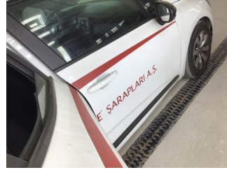
Kaporta, Kaporta > Etiket Yapıştırılmış