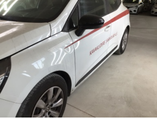
Kaporta, Kaporta > Etiket Yapıştırılmış