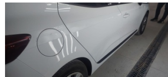
Kaporta, Kaporta > Etiket Yapıştırılmış