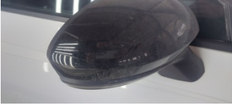
Dikiz aynası, sağ, Dış dikiz aynası kapağı > Çizik