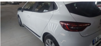
Kaporta, Kaporta > Etiket Yapıştırılmış