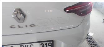
Kaporta, Kaporta > Etiket Yapıştırılmış