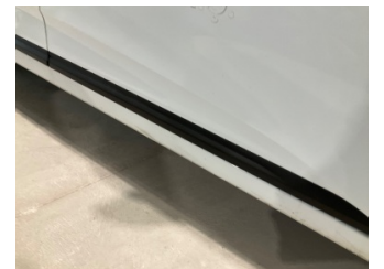
Marşbiyel, sağ, Marşbiyel, sağ > Vuruk