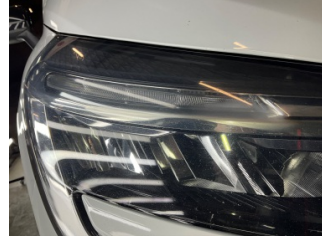
Farlar, Far camı, sağ > Islak-Nemli