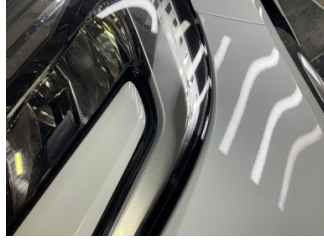
Farlar, Far camı, sol > Islak-Nemli