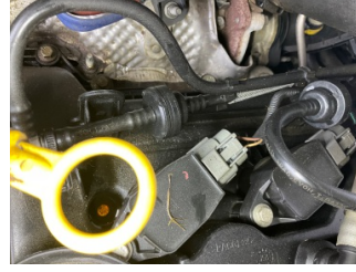
Motor, Motor/Yakıt sistemi > Sızdırıyor