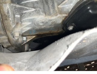
Motor, Motor > Yağ Kaçağı