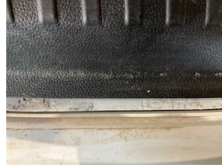
Arka bölüm, Arka sac/panel > Standart Dışı Onarım