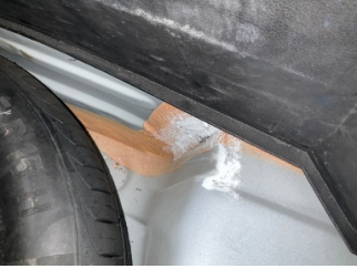
Arka bölüm, Arka sac/panel > Standart Dışı Onarım