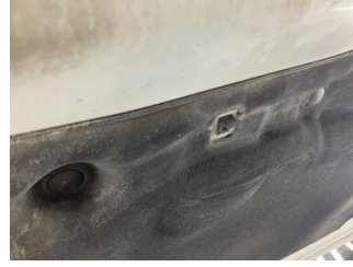
Motor kaputu, Dayama çubuğu/Amortisör > Hasarlı