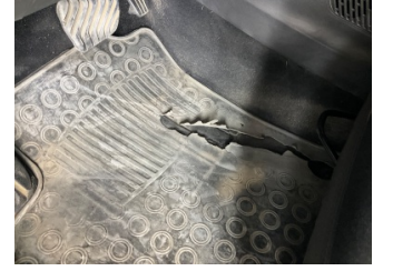
Taban, Paspaslar > Hasarlı