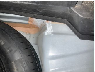
Arka bölüm, Bagaj havuzu > Ezic