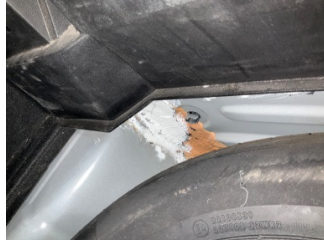
Arka bölüm, Arka sac/panel > Standart Dışı Onarım