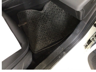
Taban, Paspaslar > Hasarlı