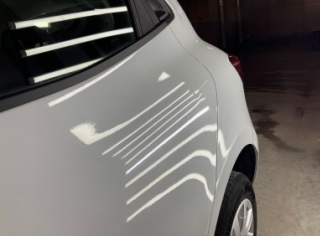
Kapı, sol arka, Kapı, sol arka > Vuruk