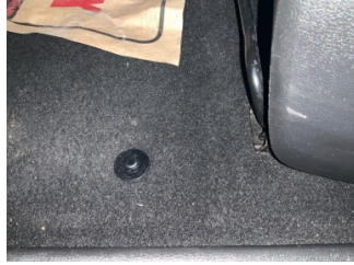
Döşemeler/Kapaklar, Döşemeler/Kapaklar > Yakıcı Madde Ile Zarar Görmüş