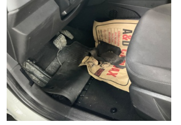
Taban, Paspaslar > Hasarlı