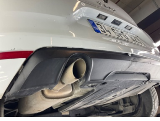
Tampon, arka, Spoiler > Sabitlemesi Hatalı

Sayfa: 11/12 Araç Çıkış Tarihi: 18.04.2026 13:03