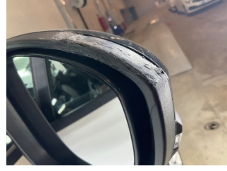
Dikiz aynası, sağ, Dış dikiz aynası çerçevesi > Hasarlı