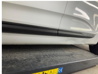
Marşbiyel, sol, Marşbiyel, sol > Hasarlı