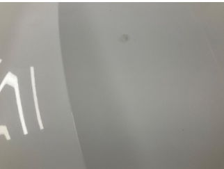
Motor kaputu, Motor kaputu > Yakıcı Madde Ile Zarar Görmüş