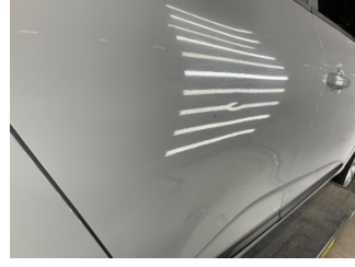
Kapı, sağ arka, Kapı, sağ arka > Vuruk