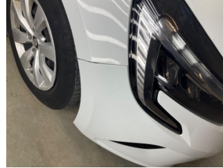
Tampon, ön, Ön tampon > Sabitlemesi Hatalı