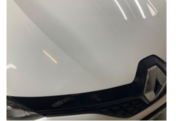
Motor kaputu, Motor kaputu > Taş izi