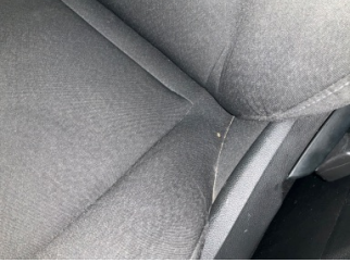
Döşemeler/Kapaklar, Döşemeler/Kapaklar > Yakıcı Madde Ile Zarar Görmüş