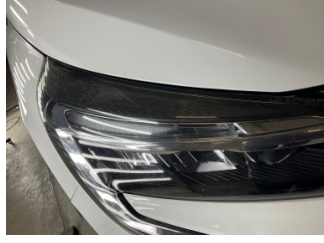
Farlar, Far camı, sağ > Deforme Olmuş