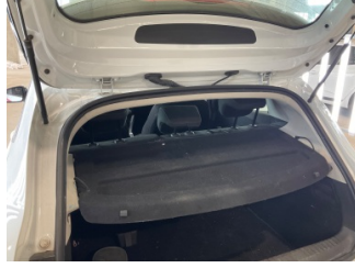
Döşemeler/Kapaklar, Pandizot > Hasarlı