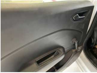
Döşemeler/Kapaklar, Kapı döşemesi, sol arka > Çizik