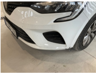
Tampon, ön, Ön tampon > Vuruk