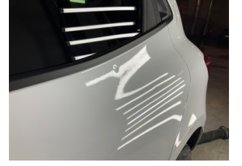
Kapı, sol arka, Kapı, sol arka > Noktasal Ezik