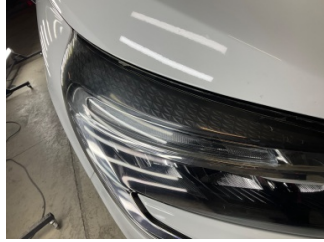
Farlar, Far camı, sağ > Deforme Olmuş