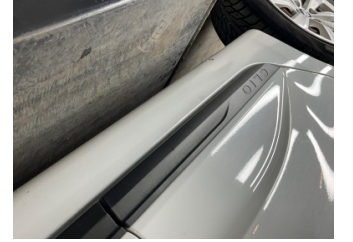
Marşbiyel, sağ, Marşbiyel, sağ > Küçük Vuruk