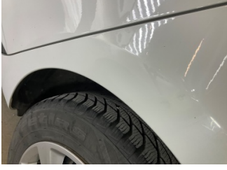
Çamurluk, sol arka, Çamurluk, sol arka > Standart Dışı Onarım

Sayfa: 10/11 Araç Çıkış Tarihi: 18.04.2026 10:16