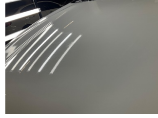
Motor kaputu, Motor kaputu > Yatkıcı Madde İle Zarar Görmüş