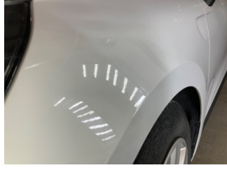
Çamurluk, sol, Çamurluk, sol > Standart Dışı Onarım