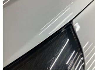
Farlar, Far camı, sol > Çatlak