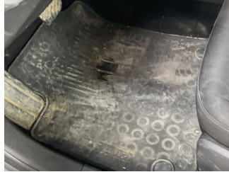
Taban, Paspaslar > Hasarlı