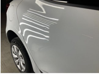
Kapı, sağ arka, Kapı, sağ arka > Noktasal Ezik